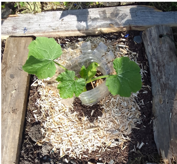
Le dispositif utilisé par Béatrice

Si je désire protéger plus spécialement une plante fragile, comme un plant de courgette, j'installe ce petit dispositif : cadre de planches, fond de bouteille en plastique crénelé et paille de miscanthus (voir photo). Bien sûr, j'ai quand-même quelques pertes, mais, en regard du nombre de limaces présentes, ce n'est vraiment pas grand-chose.